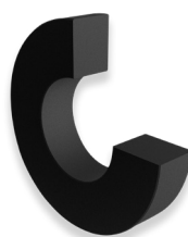
Distanziale Tipo F in versione Antistatica