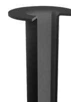
Convogliatore in versione Antistatica