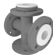
Finitura standard: vernice zincante epossivinilica grigia