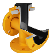
Croci uguali disponibile in versione Antistatica